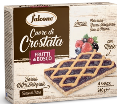
CMCFB Cuore di Crostata Frutti Rossi con Farina 100% Integrale 240g (4x60g) Red Fruit Jam Tart with 100% Wholemeal Flour 240g (4x60g)