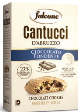
BOX18C Cantucci Cioccolato Fondente (200g) Dark Chocolate Cookies (200g)