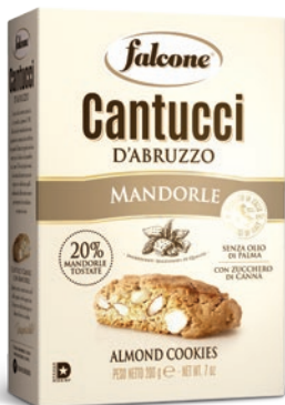
BOX18M Cantucci Mandorla (200g) Almond Cookies (200g)

Fragranti biscotti della tradizione dolciaria italiana, prodotti con ingredienti selezionati e di qualità, nei gusti classici e fruttati. Ideali da mangiare in qualsiasi occasione come un espresso, vini dolci da dessert, liquori tipici e arricchiscono gelati e semifreddi.