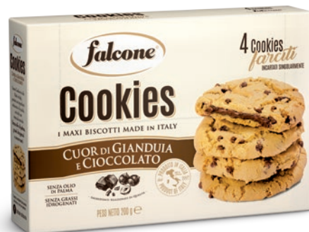
MCOOKRG Cookies al Cioccolato con ripieno Crema Nocciola 200g (4x50g) Chocolate Cookies with Hazelnut Cream filling 200g (4x50g)