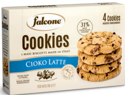
MCOOKL Cookies Cioko Latte 200g (4x50g) Milk Cookies 200g (4x50g)

prodotti con ingredienti selezionati e di qualità, senza olio di palma, grassi idrogenati e conservanti.