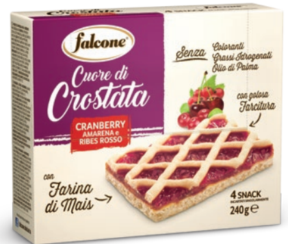
CRMFR Cuore di Crostata Cranberry, Amarena e Ribes Rosso con Farina di Mais 240g (4x60g) Cranberry, Sour Black Cherry and Red Currant Jam Tart with Corn Flour 240g (4x60g)