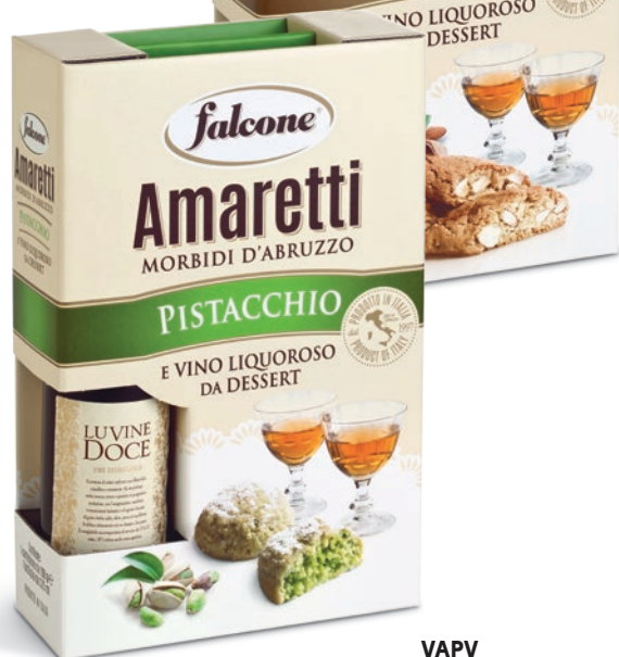
VAPV Amaretti Morbidi Pistacchio (200g) e Vino da Dessert (375ml) Sof Amaretti with Pistachio (200g) and Dessert Wine (375ml)