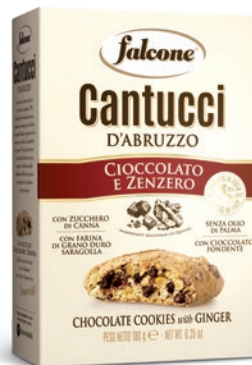
BOXZEC Cantucci Cioccolato e Zenzero (180g) Chocolate Cookies with Ginger (180g)