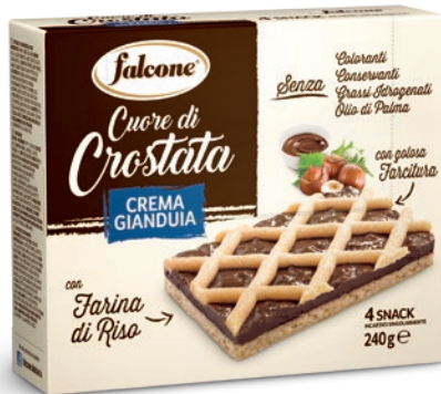
CRMGI Cuore di Crostata Crema Gianduia con Farina di Riso 240g (4x60g) Hazelnut Cream Tart with Rice Flour 240g (4x60g)