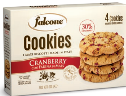
MCOOKC Cookies Cranberry 200g (4x50g) Cranberry Cookies 200g (4x50g)