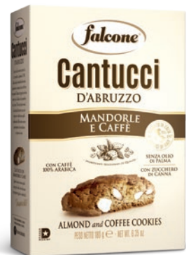
BOX18CAF Cantucci Mandorle e Caffè (180g) Almond and Coffee Cookies (180g)