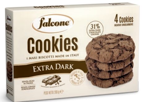
MCOOKE Cookies Extra Dark 200g (4x50g) Dark Chocolate Cookies 200g (4x50g)