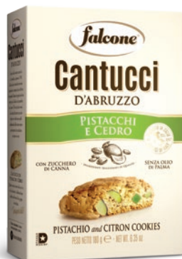
AS180PC Cantucci Pistachio e Cedro (180g) Pistachio and Citrus Cookies (180g)