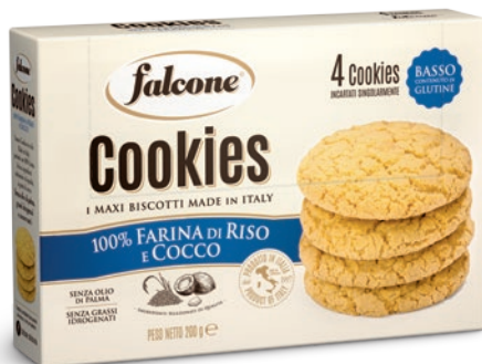
MCOOKRC Cookies 100% Farina di Riso 200g (4x50g) 100% Rice Flour Cookies 200g (4x50g)