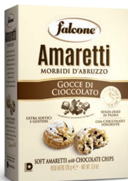
AMACIO170 Amaretti Morbidi Gocce di Cioccolato (170g) Sof Amaretti with Chocolate Chips (170g)