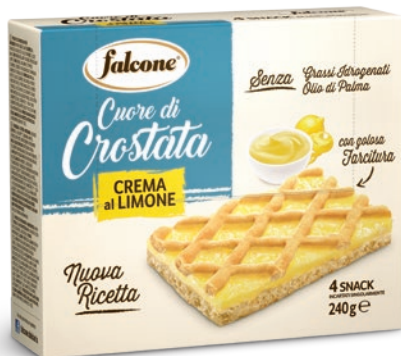
MCCL752 Cuore di Crostata Crema al Limone 240g (4x60g) Lemon Cream Tart 240g (4x60g)