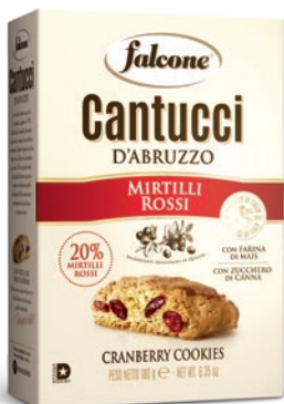
AS180MI Cantucci Mirtilli Rossi (180g) Cranberry Cookies (180g)