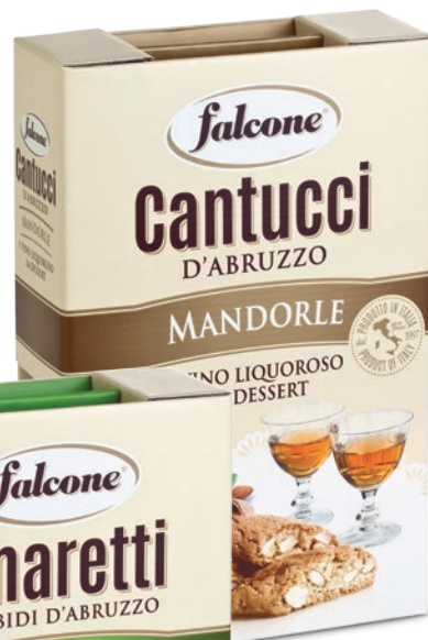
VSC1 Cantucci Mandorla (250g) e Vino da Dessert (375ml) Almond Cookies (250g) and Dessert Wine (375ml)