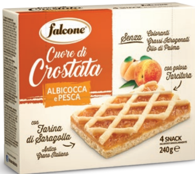
CRMAL Cuore di Crostata Albicocca e Pesca con Farina di Saragolla 240g (4x60g) Apicot and Peach Jam Tart with Saragolla Flour 240g (4x60g)

Golosi tranci di Crostata arricchiti con farine speciali e golose farciture, senza olio di palma e grassi idrogenati.