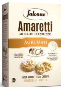
AMAG170 Amaretti Morbidi Agrumati (170g) Sof Amaretti with Citrus (170g)