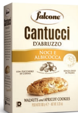
AS180AN Cantucci Noci e Albicocca (180g) Walnut and Apricot Cookies (180g)