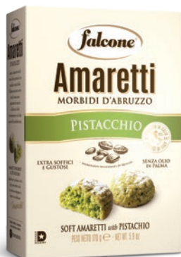
AM170P Amaretti Morbidi Pistacchio (170g) Sof Amaretti with Pistachio (170g)