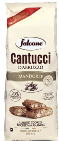
CM18006 Cantucci Mandorla (800g) Almond Cookies (800g)