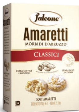
AM170 Amaretti Morbidi (170g) Sof Amaretti (170g)

I nostri Amaretti morbidi sono deliziosi pasticcini con all'interno un tenero cuore, in cui la nota amara e persistente del nocciolo di albicocca si fonde armoniosamente con il dolce sapore delle mandorle tostate. Profumati e ricchi di gusto sono ottimi da soli, ma possono accompagnare un buon espresso o vini da dessert.